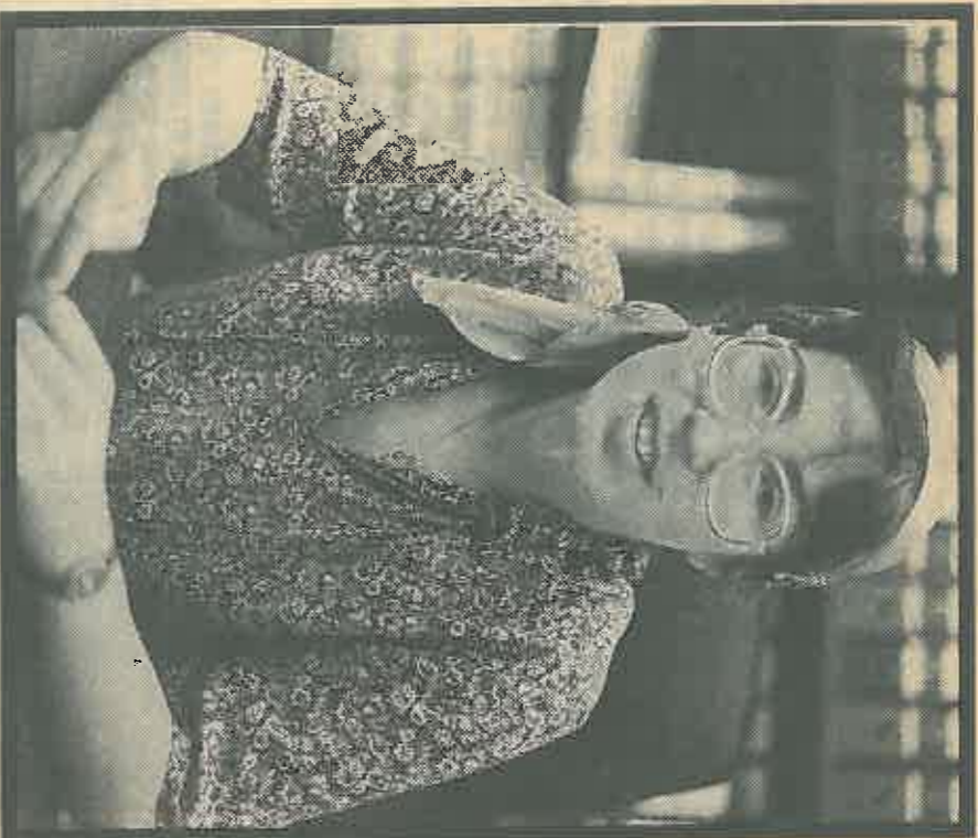
אני נאה בתדמית שיש לי של אדם אמין, שמנסה להקטיב כמעט שכו

תי בראש סדר העדיפויות שלה. ממשלת ימין לא תעשה את זה, כי בראש סדרהעדיפויות שלה עומדות ההתחלואיות, וכבר התנסו במד משלה שטרנספר נכנס אליה. מכהינה ריאלית אנו לא מוסלים את הליכוד וגם המערך לא שר של את הליכוד במסגרת ממשלת אהודת לאר- מית.